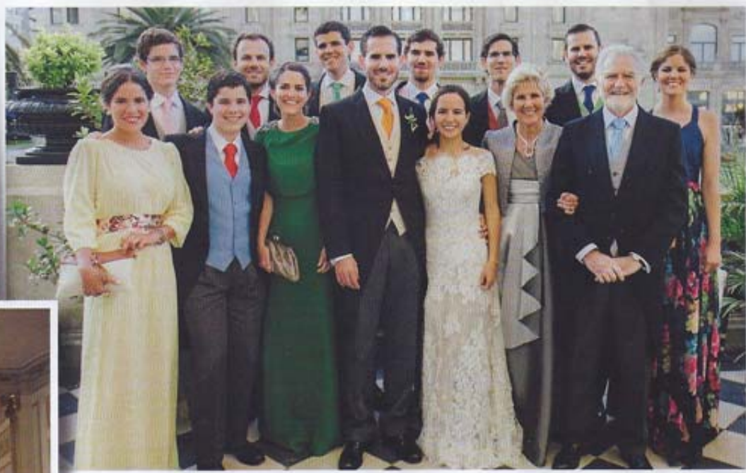
Fotografía de la familia del novio, sus padres y sus diez hermanos.